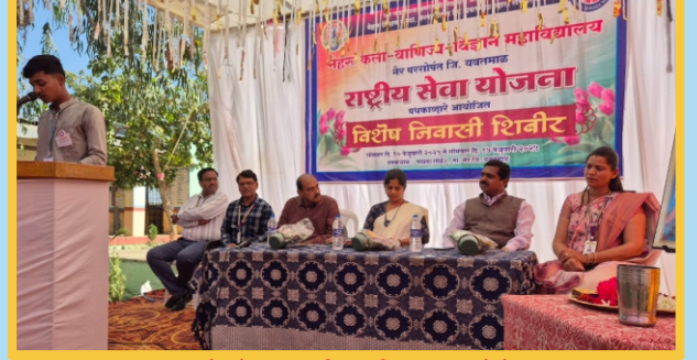
रा.से.यो. निवासी शिबीर पाण्ड गळे