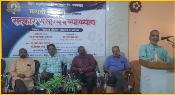
मराठी विभाग, सत्कार समारंभ व व्याख्यान