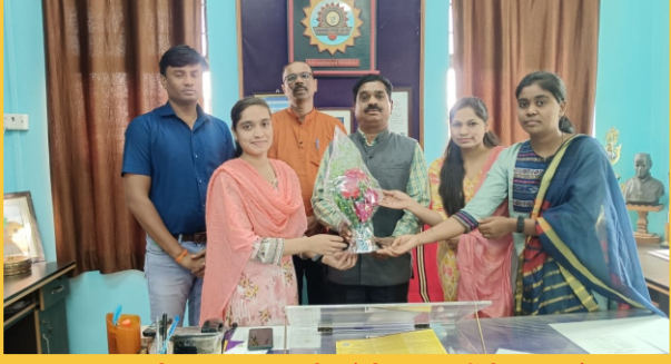
एम.ए.मराठी विभाग, विद्यापीठ मेरीट विद्यार्थीनीचा गुणगौरव