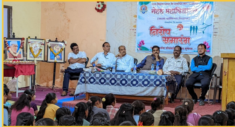
कनिष्ठ महाविद्यालय निरोप समारंभ