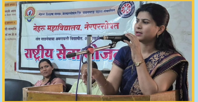
विद्यार्थीनी जागरूकता सप्ताह