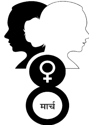
जागतिक महिला दिन