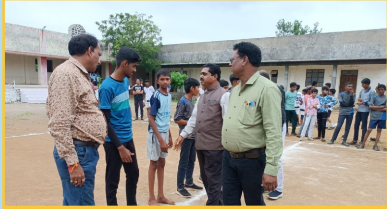
कनिष्ठ महाविद्यालय क्रिडा स्पर्धा